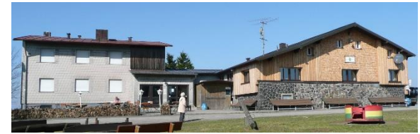
Keller 2010 renoviert

Fassade links asbesthaltig und nicht isoliert rechts nur teilweise erneuert