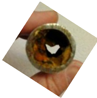
Leitungsrohr der Kissinger Hütte

Haben Sie ein Herz für unsere Kissinger Hütte.